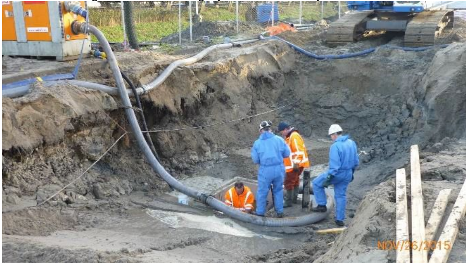
Foto: aanbrengen riolering George Stephensonweg

Er is de afgelopen weken hard gewerkt aan de riolering in de George Stephensonweg. Na het aanbrengen van de riolering zijn delen van de rijbaan hersteld.