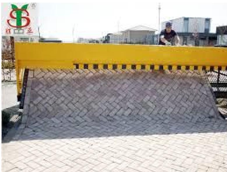
Foto: Aanbrengen bestrating met Tigerstone

Als laatste wordt de rijbaan aangebracht. De aannemer Pijnacker Infra wil dit uitvoeren met een Tigerstone. Met dit apparaat wordt de bestrating als een soort deken uitgerold.